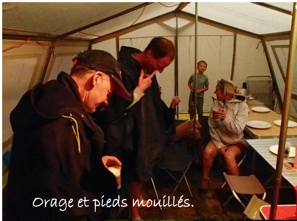
Orage et pieds mouillés.