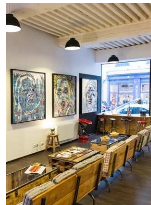
expo Wud & Iron - Lyon