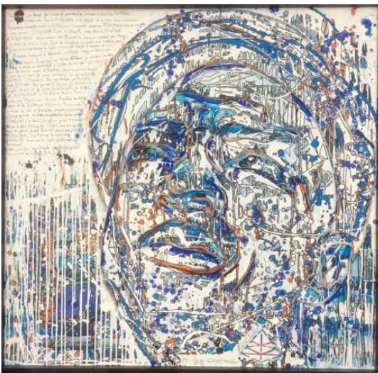
« aux rêves qui ne dorment plus » 2015