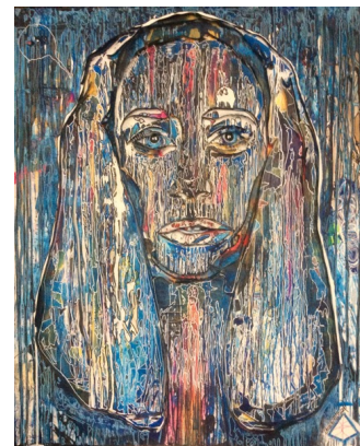
liberté, égalité, fraternité, laïcité et féminisme : travail en cours de réalisation 2016