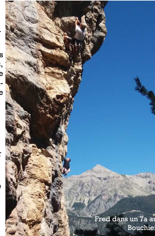
Fred dans un 7a au Bouchier