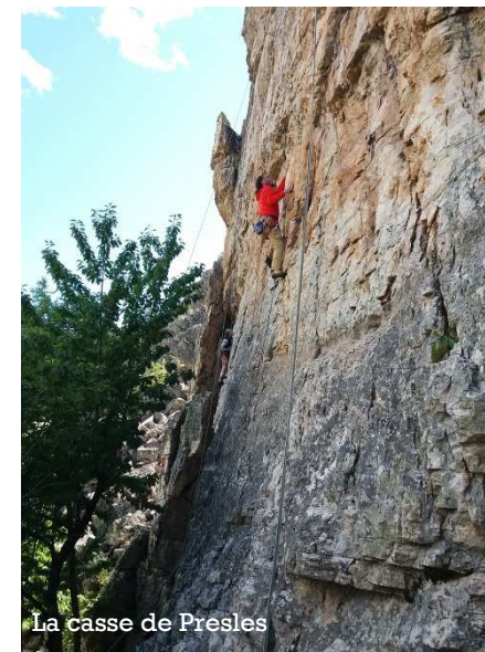
La casse de Presles