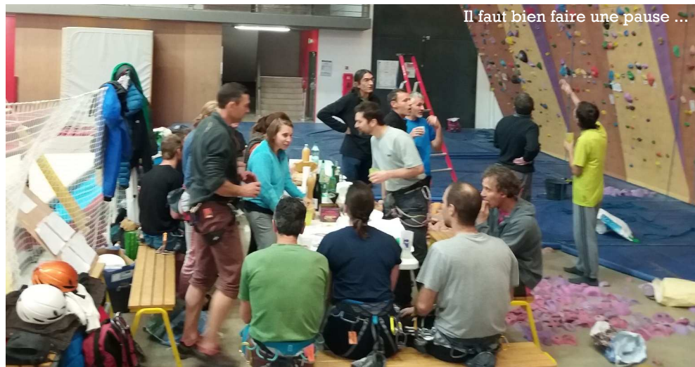
Il faut bien faire une pause ...