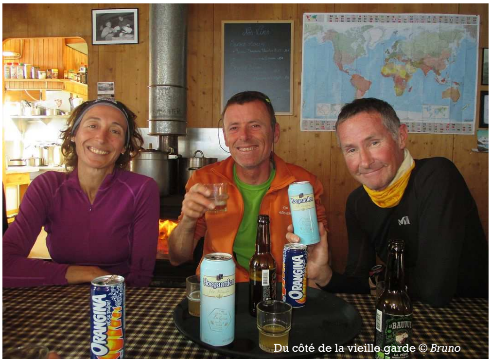
Du côté de la vieille garde

Le programme 2018 est équilibré entre sorties initiations, courses peu difficiles et itinéraires plus « pêchus ».